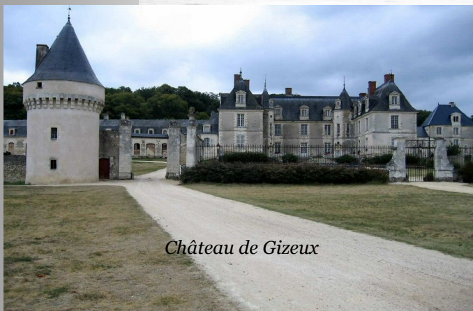
Château de Gizeux