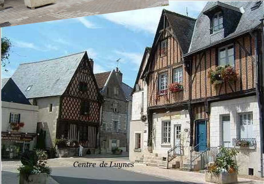
Centre de Luynes