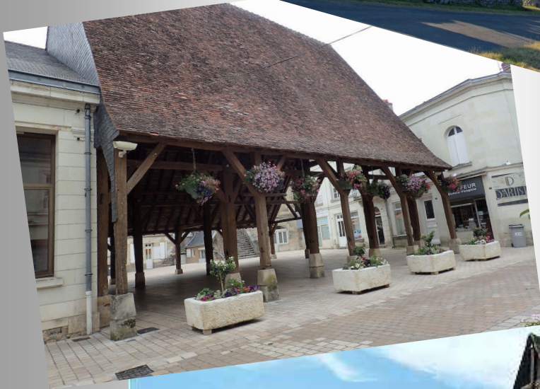
Halles de Luynes