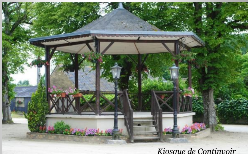
Kiosque de Continvoir