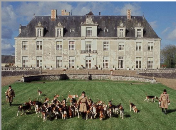
Château de Champchevrier